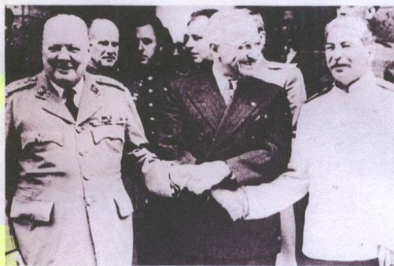
Die „Großen drei“ in Potsdam im Jahre 1945

Im Übrigen weist das Schreiben des Innenministeriums darauf hin, dass die Fälle derjenigen noch nicht „gelöst“ seien, die vor 1930 geboren wurden, und zwar in Gebieten, die aufgrund der Pariser Vorortverträge (etwa Versailles) mit oder ohne Volksabstimmung abgetreten werden mussten, etwa Nordschleswig oder Eupen/Malmédy. Das sei jedoch „im Sinne eines pragmatischen Ansatzes hinnehmbar, weil nur noch wenige Personen betroffen sind und von diesen – soweit bekannt – keine Berichtigungen verlangt wurden“.