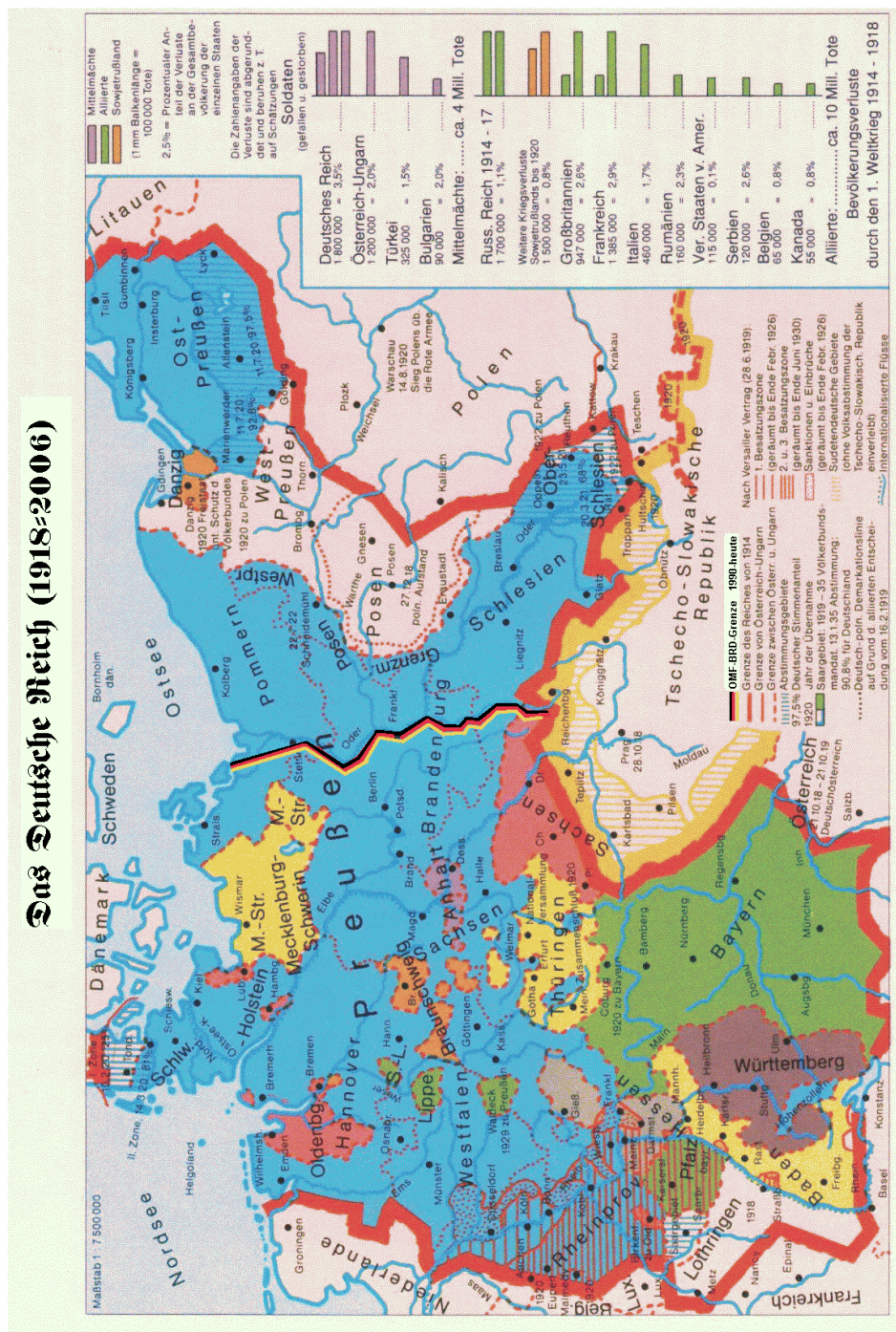
Angepasst nach: Deutsche Geschichte 1756-1944, Lingen Verlag 1992, Köln, S. 434

Damit stellt sich die territoriale Erstreckung des Deutschen Reiches heute noch so dar, s. nachfolgende Abbildung: